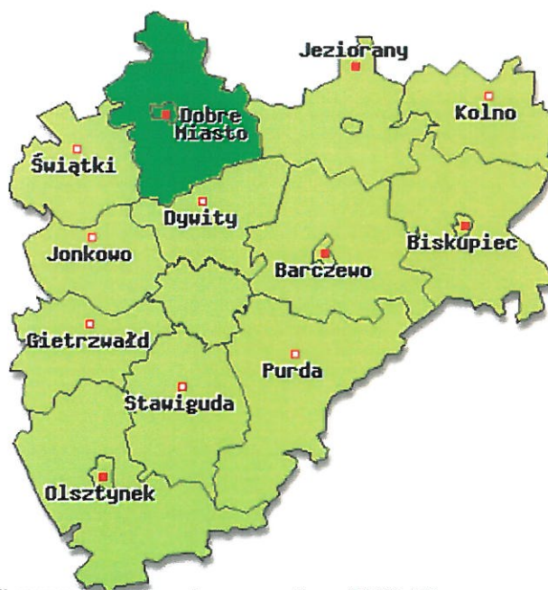
Położenie Dobrego Miasta na tle powiatu olsztyńskiego

W opracowaniu wykorzystano mapy cyfrowe IMAGIS (R)