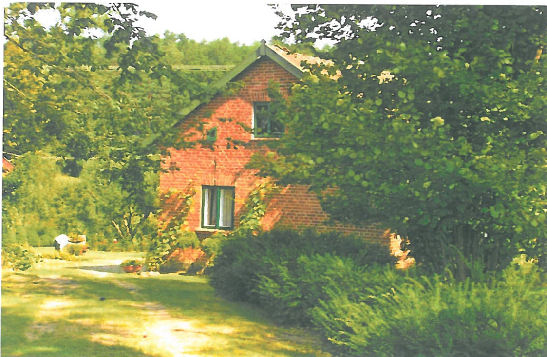
Zdjęcie 4: Budynek mieszkalny z lat 20-tych XX w.