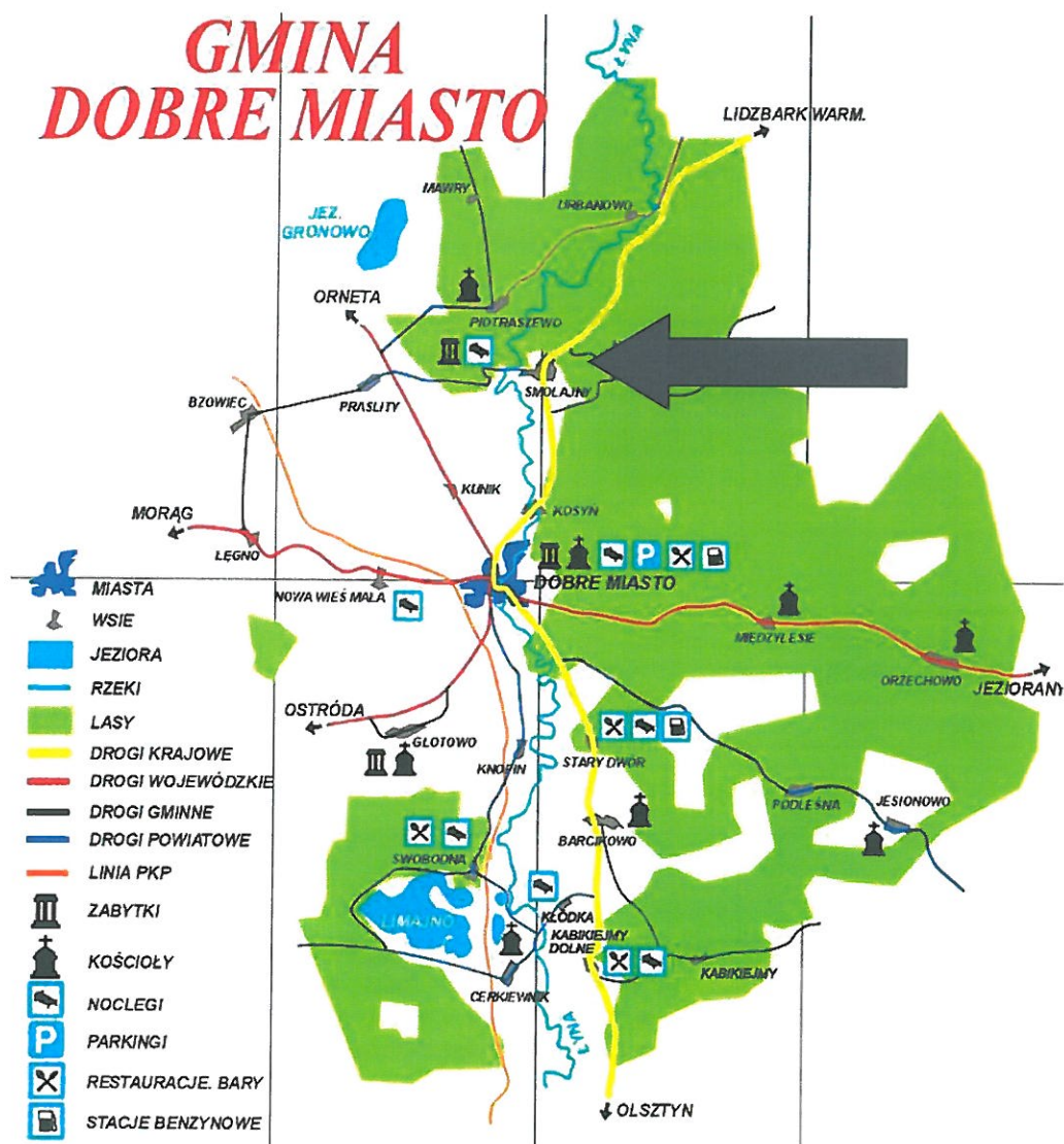
Mapa 1. Położenie miejscowości Smolajny w Gminie Dobre Miasto