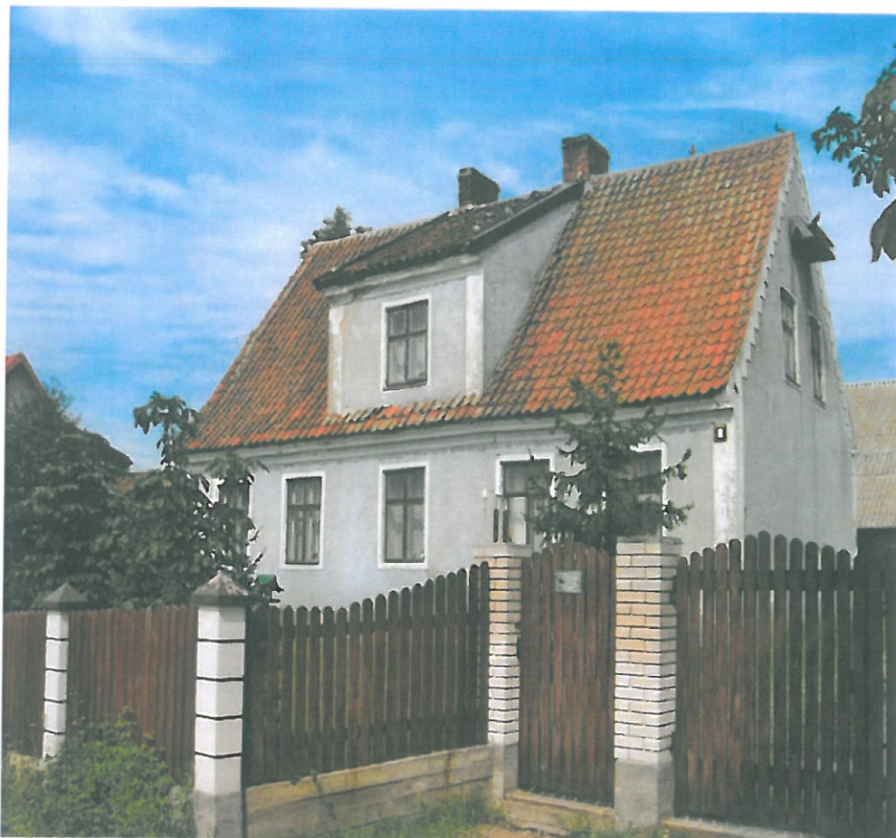
Zdjęcie 3: budynek mieszkalny z lat 20-tych XX w.