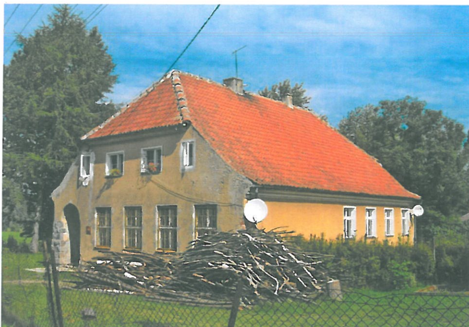
Zdjęcie 5: Budynek dawnej szkoły powstały w latach 20-tych XX w.