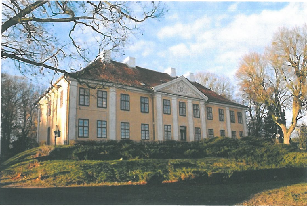
Zdjęcie 1: Pałac biskupów warmińskich