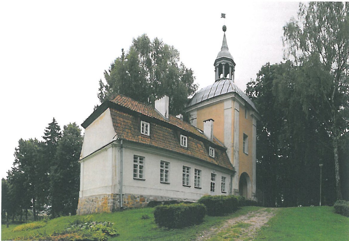
Zdjęcie 2: Brama wjazdowa do pałacu